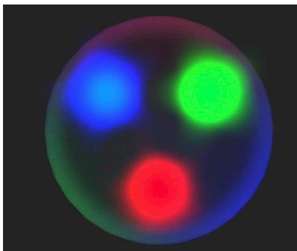
THE ANSWERING MACHINE, TINY FESTIVAL PRODUCERS