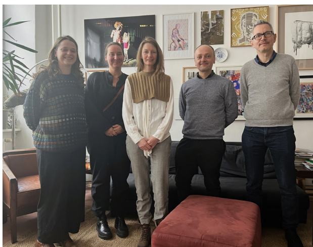
IGBK MÖTE I BERLIN, PRESENTATION AV THE SWAN-MODEL FÖR TYSKA RESIDENS