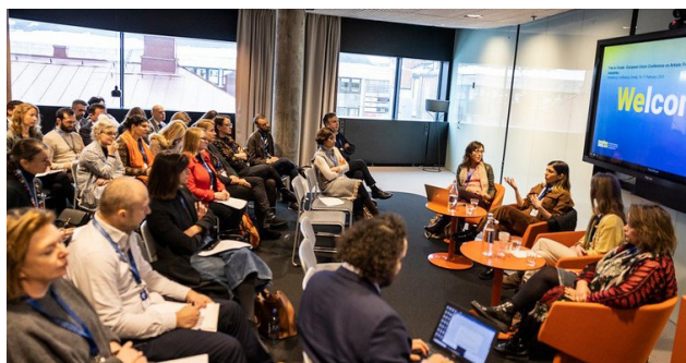
FREE TO CREATE 2023, EUROPEISKA UNIONENS KONFERENS OM KONSTNÄRLIG FRIHET