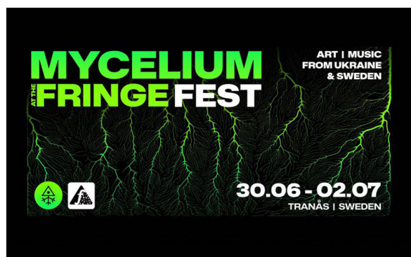
TRANÅS FRINGE FESTIVAL, MYCELIUM NETWORK