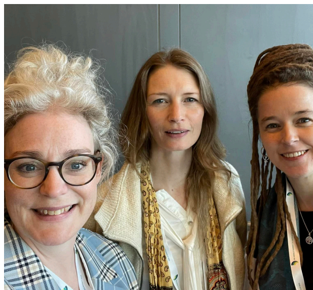
WORLD SUMMIT ON ARTS AND CULTURE, IFFACA, KULTURRÅDET