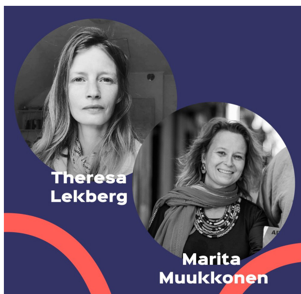
HOW BORDERLESS IS CULTURE? KULTUURIKOMPASS, TARTU