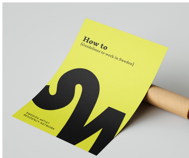
"HOW TO GUIDE" FÖR KONSTNÄRER